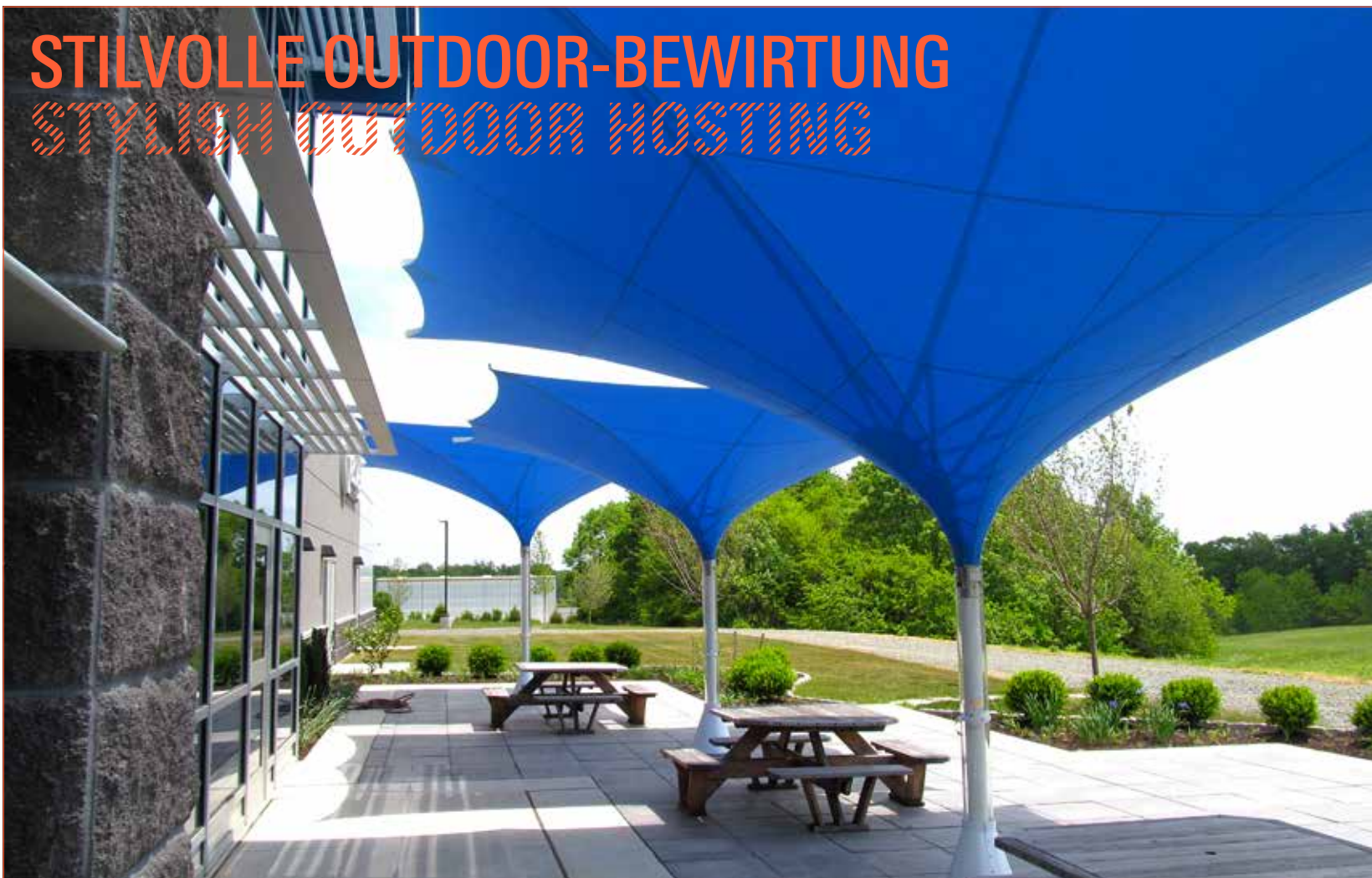
01_ Eingang. Entrance.